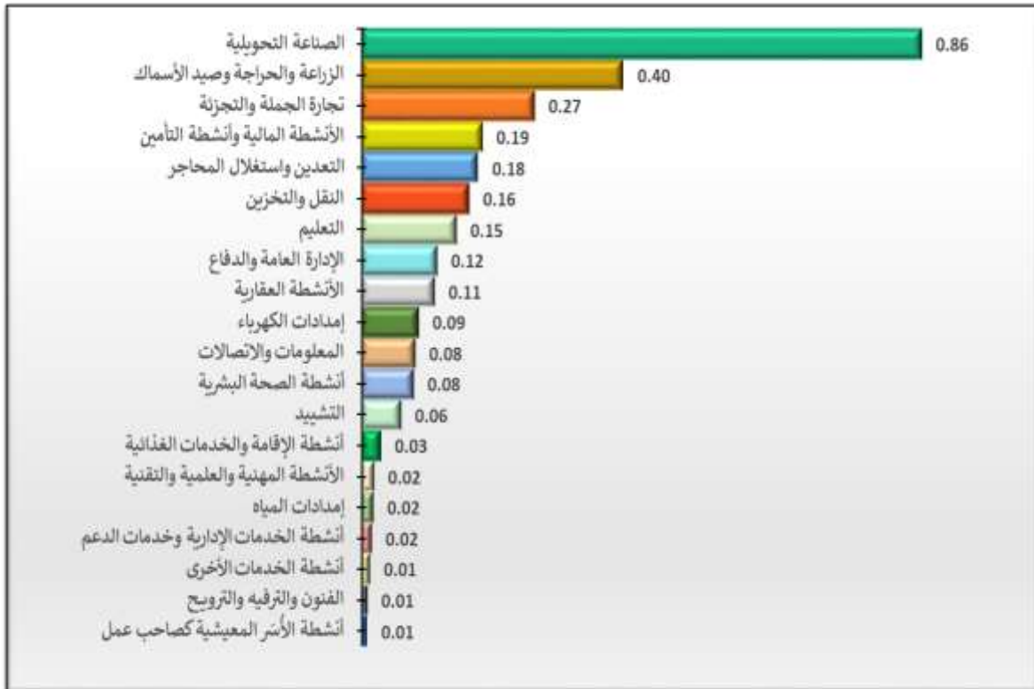
الشكل رقم (3): مساهمة القطاعات الاقتصادية في نسبة النمو المتحقق بالأسعار الثابتة والبالغة 2.9% خلال الربع الأول من عام 2026

أما فيما يخص مساهمة القطاعات في النمو الكلي المتحقق بالأسعار الثابتة، فقد سجّل "قطاع الصناعات التحويلية" أعلى مساهمة بلغت 0.86 نقطة مئوية، تلاه "قطاع الزراعة" بمساهمة مقدارها 0.40 نقطة مئوية، ثم "قطاع تجارة الجملة والتجزئة" بمساهمة مقدارها 0.27 نقطة مئوية من إجمالي النمو الكلي المتحقق (الشكل رقم 3).