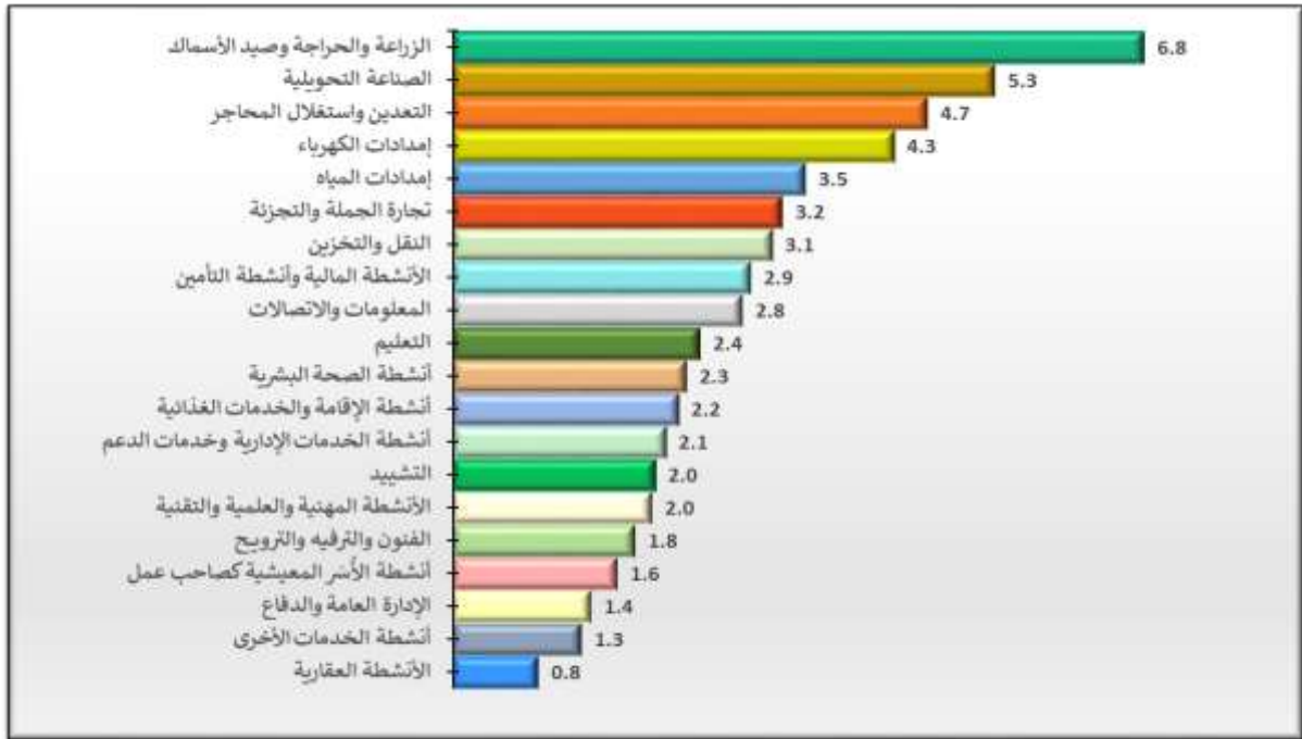
الشكل رقم (2): نمو القطاعات الاقتصادية بالأسعار الثابتة (%) خلال الربع الأول من عام 2026

أما فيما يخص مساهمة القطاعات في النمو الكلي المتحقق بالأسعار الثابتة، فقد سجّل "قطاع الصناعات التحويلية" أعلى مساهمة بلغت 0.86 نقطة مئوية، تلاه "قطاع الزراعة" بمساهمة مقدارها 0.40 نقطة مئوية، ثم "قطاع تجارة الجملة والتجزئة" بمساهمة مقدارها 0.27 نقطة مئوية من إجمالي النمو الكلي المتحقق (الشكل رقم 3).