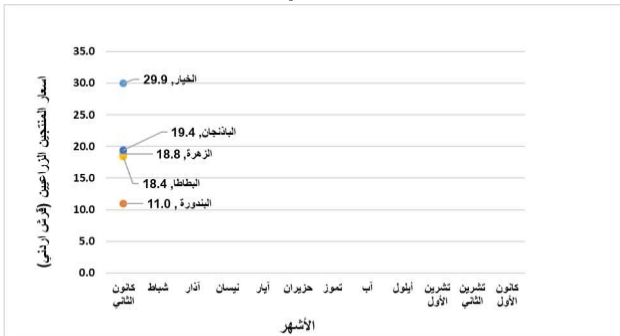
شكل 1: التغير في اسعار المنتجين الزراعيين للمحاصيل الرئيسية لعام 2026 (قرش أردني)

الجدير بالذكر أن دائرة الإحصاءات العامة قامت بمراجعة منهجية جمع بيانات الأسعار الزراعية من خلال لجنة فنية متخصصة من دائرة الإحصاءات العامة ووزارة الزراعة بناءً على توصيات لجنة الخبراء الدائمة للإحصاءات الزراعية، المنبثقة عن الاستراتيجية الوطنية الزراعية، وبغرض تطوير جودة البيانات فقد تم الاعتماد على بيانات الأسعار الزراعية لكافة المحاصيل الزراعية الواردة من الأسواق المركزية وبشكل شهري، حيث تم اعتماد سنة 2016 كسنة أساس (100=2016) وباستخدام معادلة لاسبير لاستخراج الرقم القياسي.