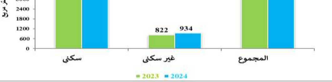
الشكل (5): مساحة الأبنية المرخصة الشهرية خلال الأشهر السبعة الأولى من عامي 2023 و2024 (بالألف متر مربع)